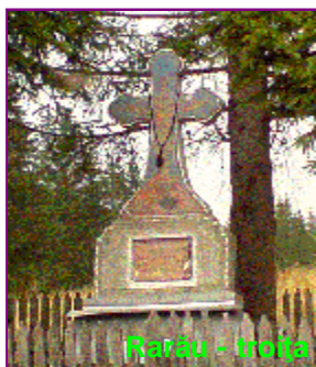
Rădău - treisă

„Armă asupra diavolului crucea Ta o ai dat nouă”